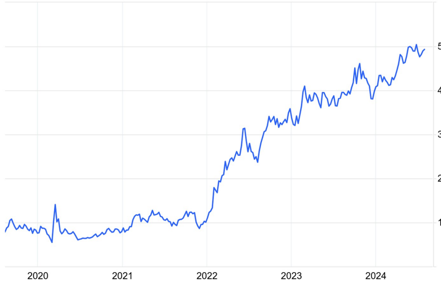
Israel 10Y Bond Yield