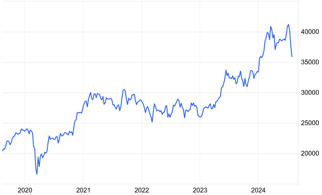
Japan Stock Market Index (JP225)