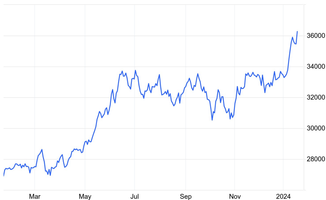
Japan Stock Market Index (JP225)